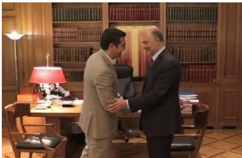
Pierre Moscovici: « Tel Ulysse de retour à Ithaque, la Grèce arrive enfin à destination aujourd'hui, dix ans après le début d'une longue récession. »