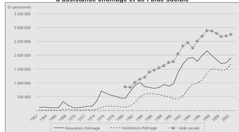
Graphique 1. Bénéficiaires des allocations d'assurance chômage, d'assistance chômage et de l'aide sociale

Sur la base des critères habituellement retenus 1 , le régime indemnitaire allemand pouvait être considéré comme offrant un socle de garanties sociales assez élevé. Le taux de couverture est assez élevé, avec près de 80 % de chômeurs indemnisés au titre des régimes d'assurance ou d'assistance en 2002. La durée d'indemnisation maximum du régime contributif est assez longue. Plafonnée à 12 mois avant 1985, puis à 18 mois, elle a été relevée en 1987 à 32 mois maximum pour les chômeurs âgés de 57 ans et plus dans le cadre des politiques d'incitation aux retraits précoces d'activité mises en place au milieu des années 1980, basées sur le jeu combiné des dispositifs de durée d'indemnisation longue, de dispense de recherche d'emploi pour les