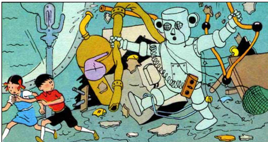
Jo, Zette et Jocko. Le Manitoba ne répond plus , 1952

L'étude de référence est celle de Frey et Osborne [9] : elle prévoit que 47 % des emplois sont menacés par l'automatisation aux Etats-Unis. Les autres études sont de simples décalques, par exemple celle du cabinet Roland Berger qui prévoit la destruction de 3 millions d'emplois en France d'ici à 2025 [10],